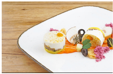
28031 Mini-Törtchen Ger. Entenbrust mit Frischkäse und Mango-Kardamom-Gel