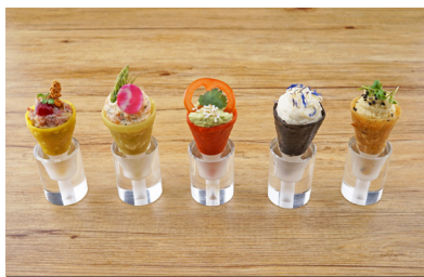
13031 Crispy Cone arabisch mit Sumak und Koriander, vegan