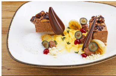
21099 Delice Schokoladen- Mousse mit Cashew-Crème auf karamelligem Haferkeks, vegan