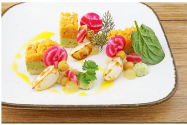
27352 Delice Avocado mit Steckrüben-Couscous und Cashews, vegan