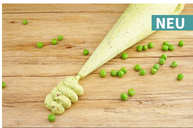
78302 Erbesen-Guacamole , vegan