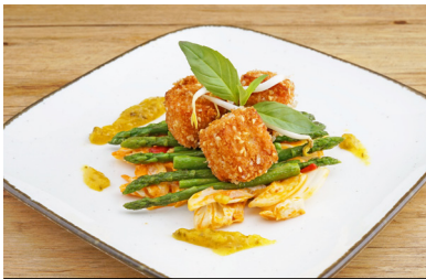
53132 Praline Graved Lachs in Sesam-Glasnudel-Crunch