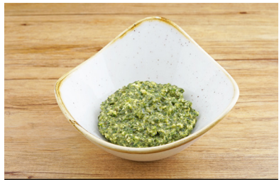
26401 Pesto Classico