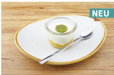
88567 Weckglas® Ziegenkäse Panna Cotta mit Pesto auf Kürbis-Chutney