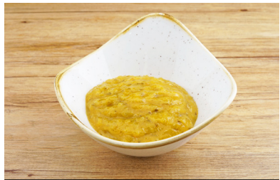
22960 Relish Ingwer Gewürzgurke , vegan