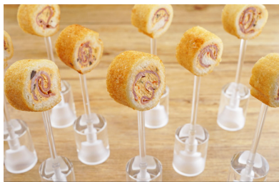
89056 Lolly Tramezzini mit Schinken und Oliven-Frischkäse