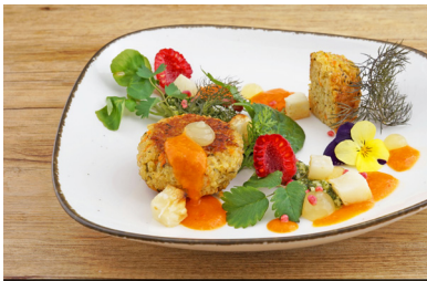
23130 Bratling Quinoa mit Zucchini und Karotte, vegan