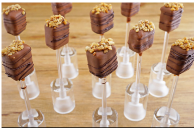
89042 Lolly Salzkarameell mit Mandeln und Vollmilchschokolade